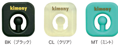
BK (ブラック) CL (クリア) MT (ミント)

世 界での販売が200万個を突破したキモニーの振動止め「クエークバスター」。売れている理由は、同社独自の振動減衰理論「マッシュルームマジック」機能にある。わかりやすく説明すると、ボールがラケット面にどんな角度で当たってもマッシュルームと呼ばれる部分が反作用として動くことで、そこで生じる振動を吸収するというユニークな仕組みなのだ。