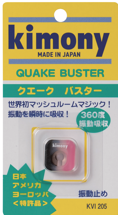
新色 (BK/PN=ブラック/ピンク)

この「クエークバスター」に使われているシリコンゴムの硬度を17パーセント上げているのが「クエークバスター SOL」。現代テニスのスタイルに適應するニュータイプの振動止めである。この両モデルの新色が3月に新発売される。「クエークバスター」はブラック/ピンク、「クエークバスター SOL」はファイアレッド。ソフトなホールド感を味わいたいなら「クエークバスター」を、シャープな弾き感を得たいなら「クエークバスター SOL」がおすすめだ。一度ラケット面に装着し、快適な打球感を体験してほしい。