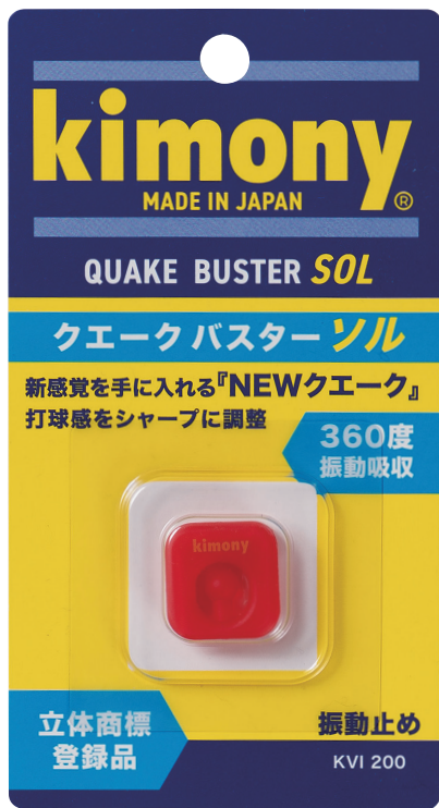
新色 (FR=ファイアレッド)